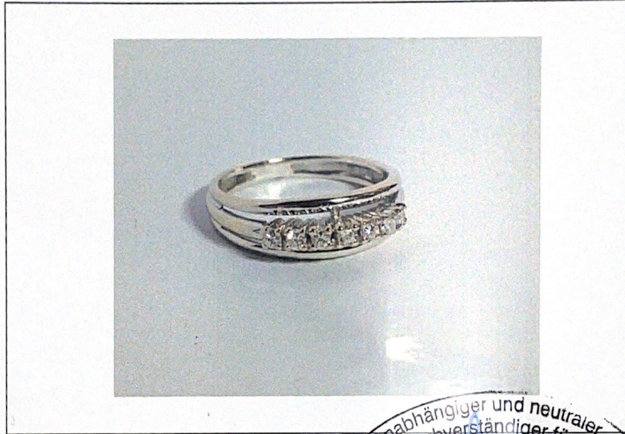
Ring in 14 Karat Weißgold mit 7 Brillanten